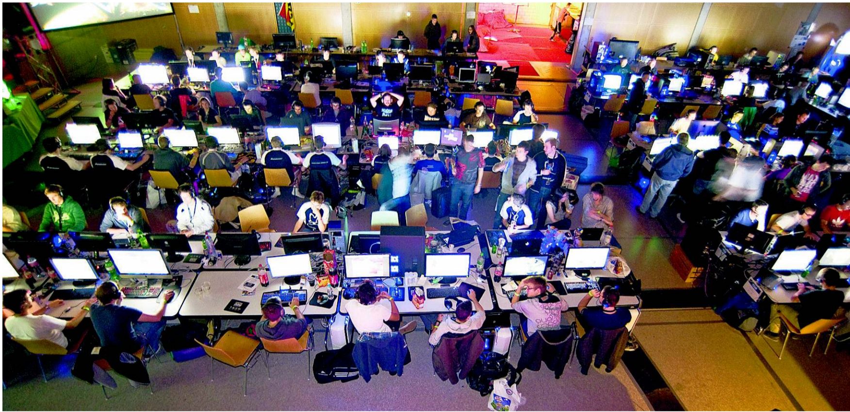
Müde, aber glückliche Gesichter. Der Spass am gemeinsamen Zocken stand an der achten «Butterlan» im Vordergrund.