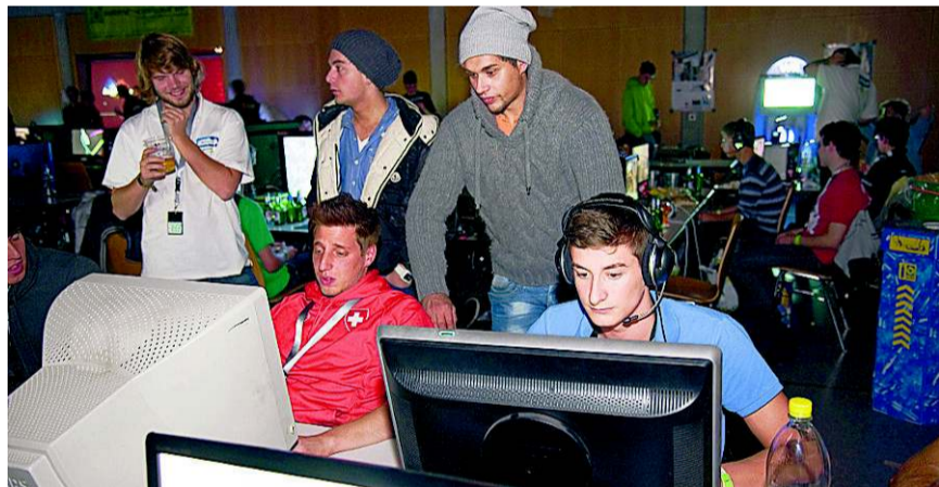
Was wohl gerade Spannendes über den Monitor flimmert?