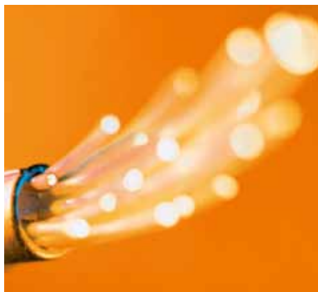
Mit der Glasfaser in die Zukunft.

Weil die GAW weder die personellen Ressourcen noch die finanziellen Mittel hat, um ein Netz