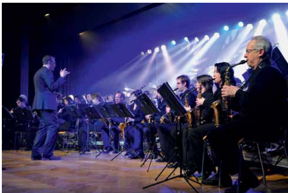
Greatest Hits mit MGL – The Entertainment Orchestra Langendorf.