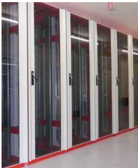
...und heute. Die neueste Technologie garantiert Telekommunikation für höchste Ansprüche.