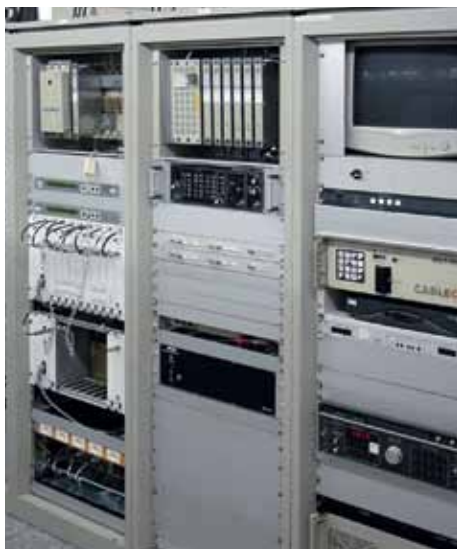
Die Kopfstation in Zuchwil ist das technische Herzstück. Die Bilder zeigen die Anlage früher...