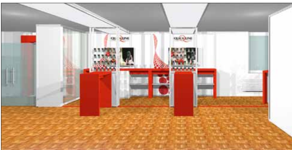
Der GAW-Shop wurde für die Angebote Mobil und Home-Verkabelung erweitert.