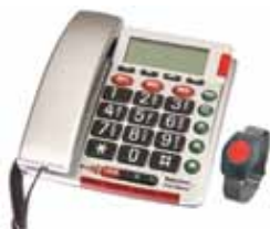
Easywave Fon CHF 230.– Telefongerät für Senioren Grosstasten Funksender für Alarm (Armband)