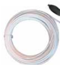
Glasfaser im Haus POF (Polymer Faser) CHF 149.– Länge 20 Meter Inkl. POF Medienkonverter für 100 Mbps (weitere Komponenten ab Sept. 2012)