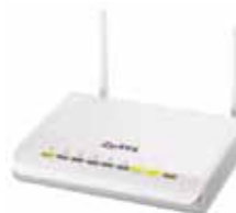
Wireless-Router Zyxel NBG-419N CHF 69.–