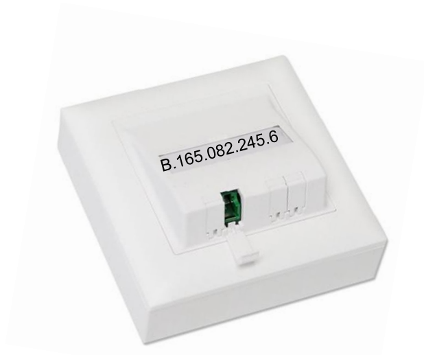
OTO Steckdose / Glasfaser-Steckdose OTO = optical telecommunications outlet

Herr Max Muster Musterstrasse 1 4500 Muster