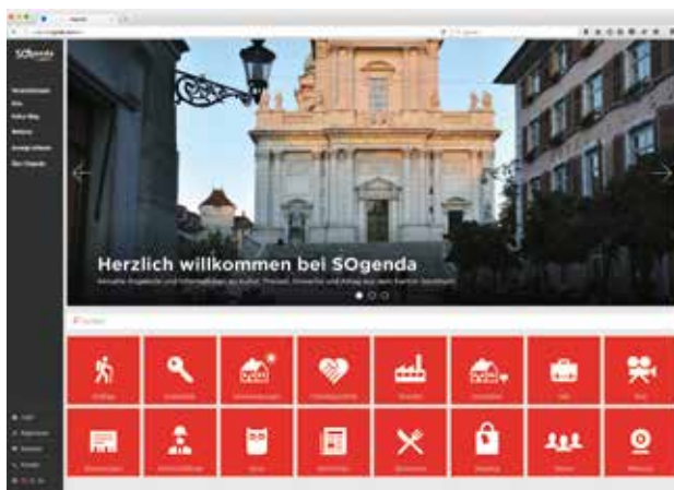
Die SOgenda ist ein Engagement der GAW.

Doch auf der Seite findet man weit mehr als «nur» Veranstaltungen. So sind Eventlokale aufgeführt, Ausflüge in der Region werden vorgestellt, man findet seine Ferienwohnung oder auch seine Traumimmobilie, es gibt Shopping-